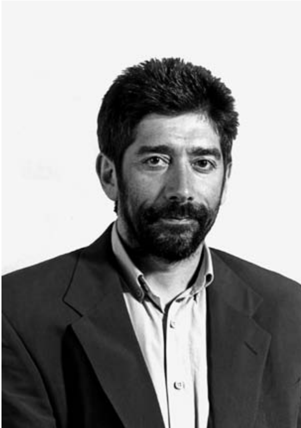
Fotografía de campaña das eleccións municipais de 1995

e sen ser identificados. Deste xeito, garantiron que o congreso se terminase de realizar (clandestinamente) ese mesmo día no que fora unha granxa de polos en Budiño (O Porriño).