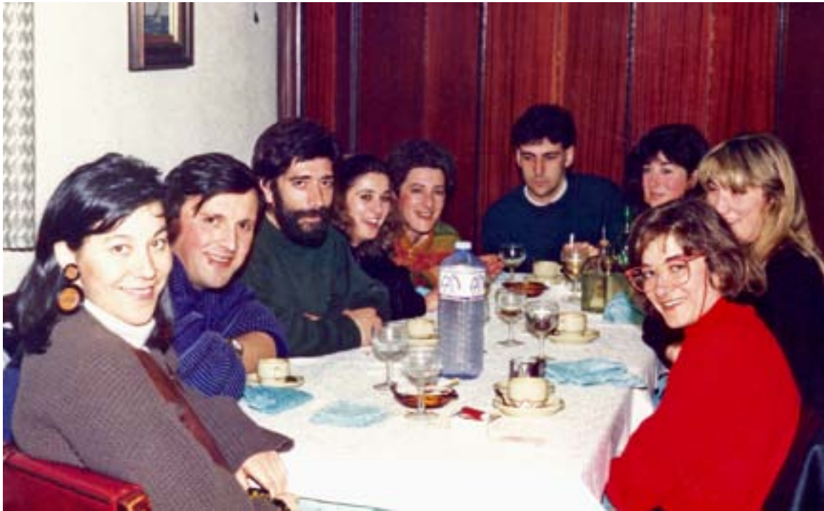
Xantar con compañeiros do IES de Tui no Arcadia de Arcade, abril de 1990