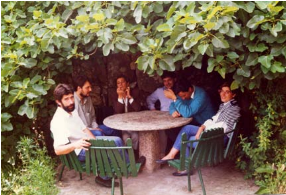
No Muíño vello de Redondela, con compañeiros do IES de Tui, xuño de 1990