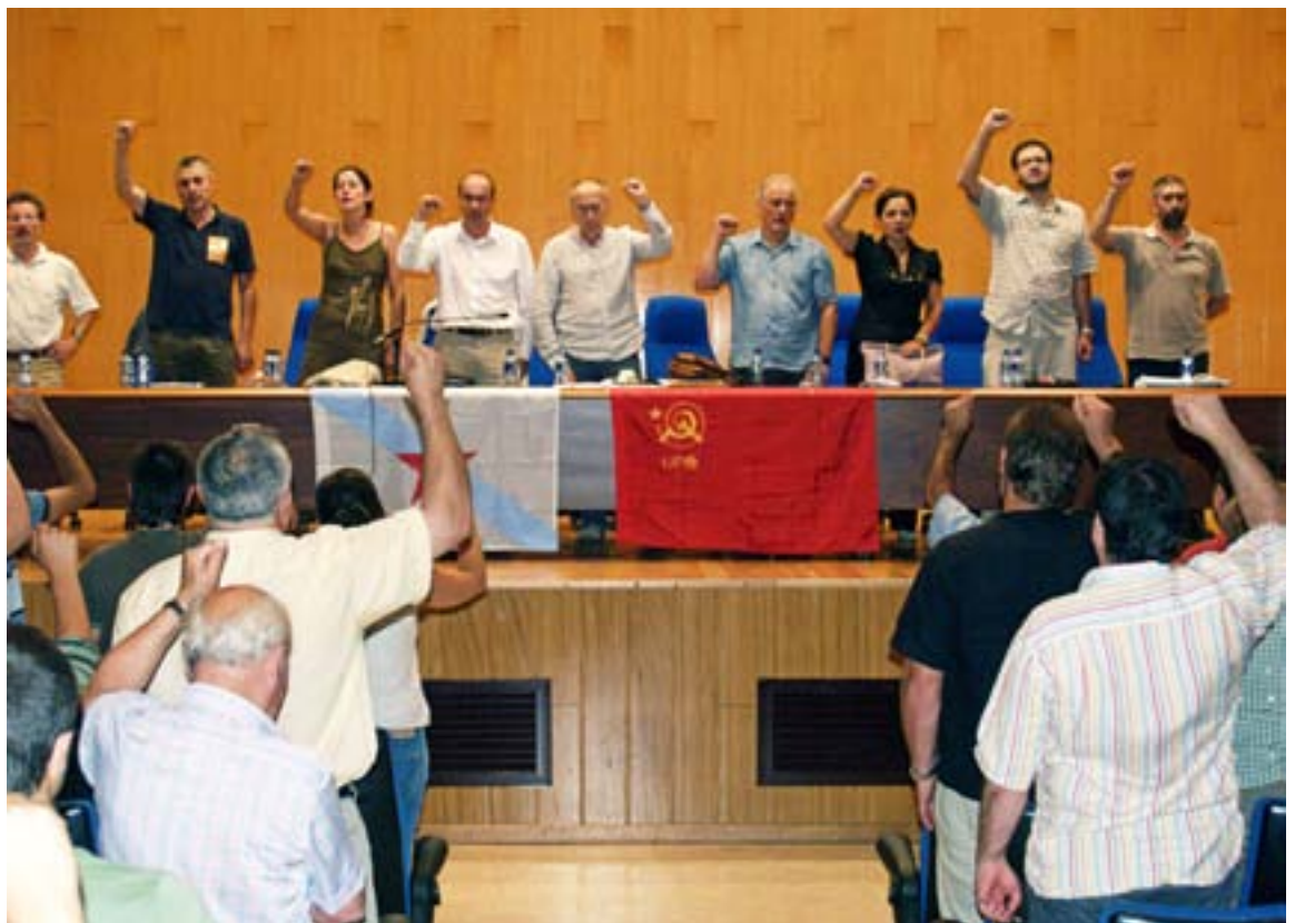
Conferencia Nacional da UPG. Ferrol, 12 de agosto de 2006