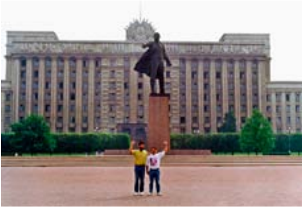
Lois nunha visita á URSS