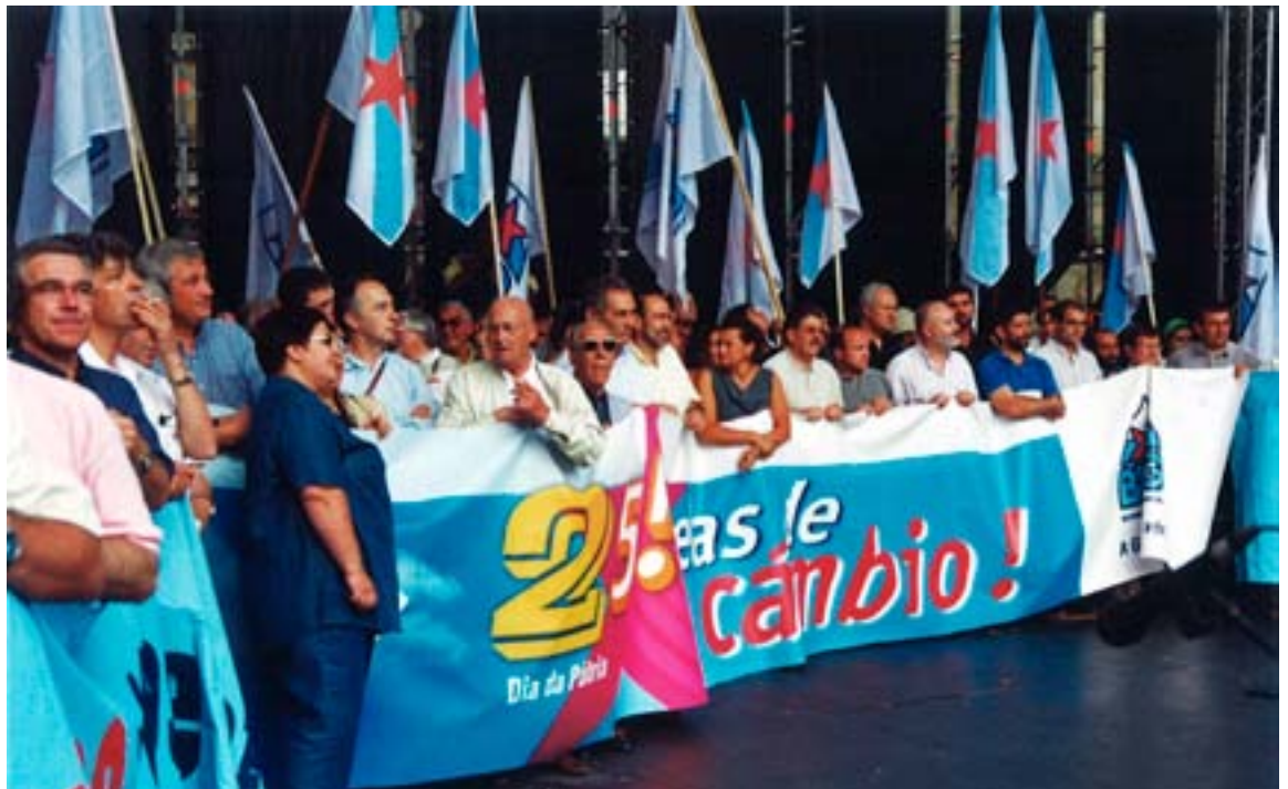
No palco da Quintana o 25 de xullo de 2001