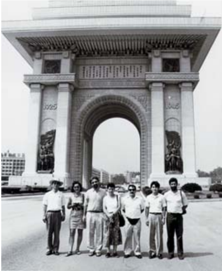
No arco do triunfo de Pionyang. Corea do Norte