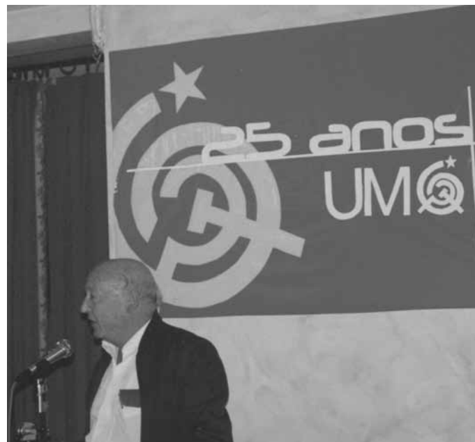
Intervindo no acto conmemorativo dos 25 anos da fundación da Unión da Mocidade Galega, a organización xuvenil da UPG, en Decembro de 2002.