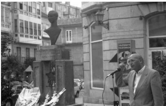
Intervención na homenaxe a Alexandre Bóveda que se organiza en Pontevedra todos os 17 de Agosto.