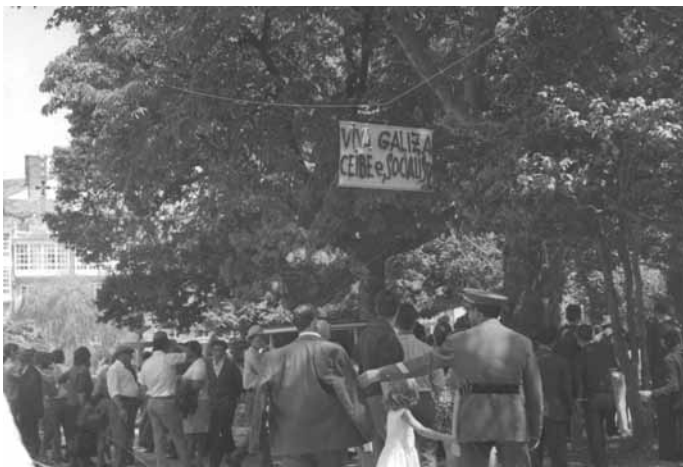
Pancarta que se pendura na entrada da Alameda de Santiago, o Día da Patria Galega de 1968.