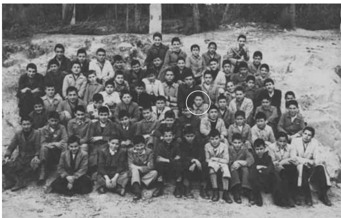
Fotografía cos alumnos do Seminario.