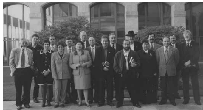
Grupo parlamentario do BNG ao completo saído dos comicios autonómicos de finais de 1997. O nacionalismo galego obtivera 400.000 votos e 18 deputados e deputadas.