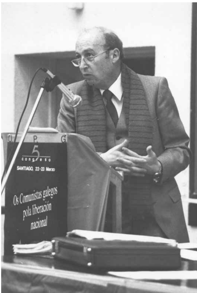
No V Congreso da UPG, Marzo de 1986.