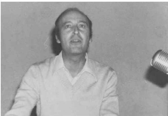
Intervindo nun acto da AN-PG en Carballo.