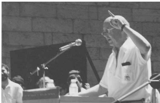
Intervención na Praza da Quintana o 25 de Xullo de 1994. A manifestación do BNG convocouse baixo o lema “Galiza Sempre”.