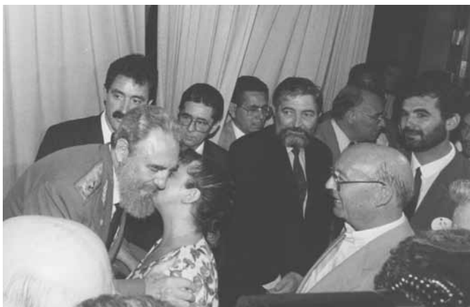
Saudando a Fidel Castro na súa visita a Galiza en Xullo de 1992. Ás súas costas, Anxo Quintana.