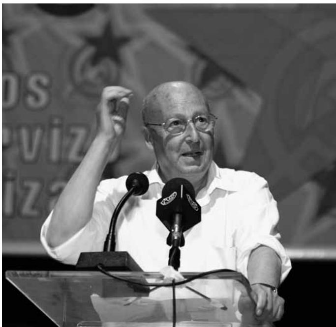
Intervindo no acto que conmemoraba o 40 aniversario da constitución da UPG, en Xullo de 2004.