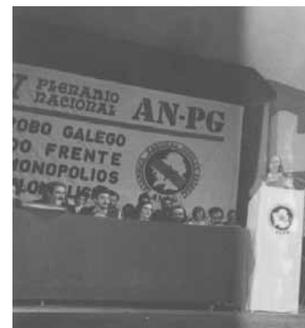
Intervención na clausura do IV Plenario Nacional da AN-PG, en Decembro de 1979.