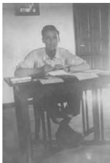
Na mesa de estudo da casa natal.