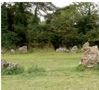
Cromlechs e aliñamentos en Inglaterra

son os donos. Os máis serios neste traballo da vixilancia do tesouro son os mouros que gardan os tesouros en sacos atados con mil nós. Outras veces a gardadora é unha vella fea cos ollos pitañosos e coxa, e hai gardadores animais, reais ou imaxinarios, con aparencia de basiliscos, serpes ou cobras. Os gardadores que máis se aledan cando alguén se fai co tesouro son os xigantes, que aínda botan unha man e axudan a carrexalos. Tamén vixían tesouros os ananos, seres que viñeron de fóra, que gardan e limpan os tesouros disque propiedade dun bispo de Santiago, seguramente os mesmos desaparecidos nun gran roubo que houbo en Roma. E as fadas (mouras?) que se presentan en figura de moza fiadora, por veces canibal que devora os seus propios fillos, por veces posuídora dun espello que embelece ou que rouba ou secuestra o alento (o que é o mesmo ca roubarlle a vida) a quen se mira nel.