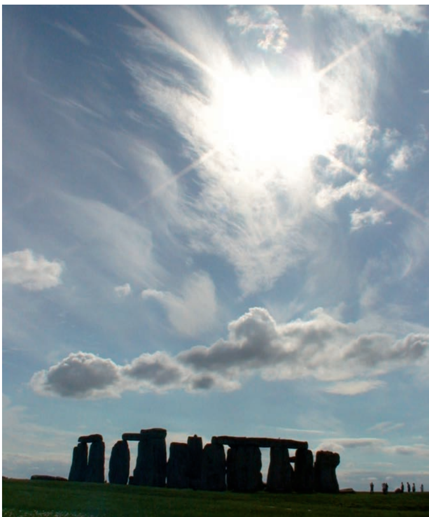
Crómlech de Stonehenge, Inglaterra

No texto de Cunqueiro emerxen as preguntas e aboian as respostas: Que son e de quen son os tesouros? Quen os garda e protexe? Como son, que figura teñen? De que están feitos? Como se comportan e como se conseguen? Ou “A miña pregunta derradeira é responderme que é o que pensa e fai un galego diante dun tesouro, xa desconfiado, xa marabillado, ousando ou temendo, crendo ou descrendo...”