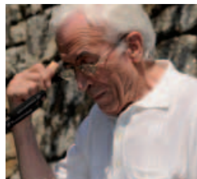
Asistentes ao I Congreso da Emigración Galega

Non, era espontáneo, eu sabía que era a miña fala, a de meus pais, meus avós; e a da escola era outra. A mestra na escola deixábanos falar en galego, pero un día díxonos -porque lle orde-