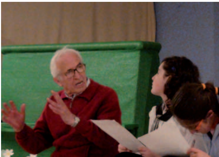
Xosé Neira Vilas sendo entrevistado por unha nena no CEIP do Foxo

naran a ela- de agora en diante “debeis hablar en castellano, dentro y fuera de la escuela”. E nós dixemos, non. Diante da escola si, pero fóra non. As nenas que ían camiñando na mesma dirección que a mestra acompañábana e falaban con ela. Pero desde que ela dixo iso, as nenas deixaron de acompañala. As nenas dáballe vergoña falar entre elas en castelán pola aldea adiante. Se viña un de fóra, admitíase que se lle falara castelán.