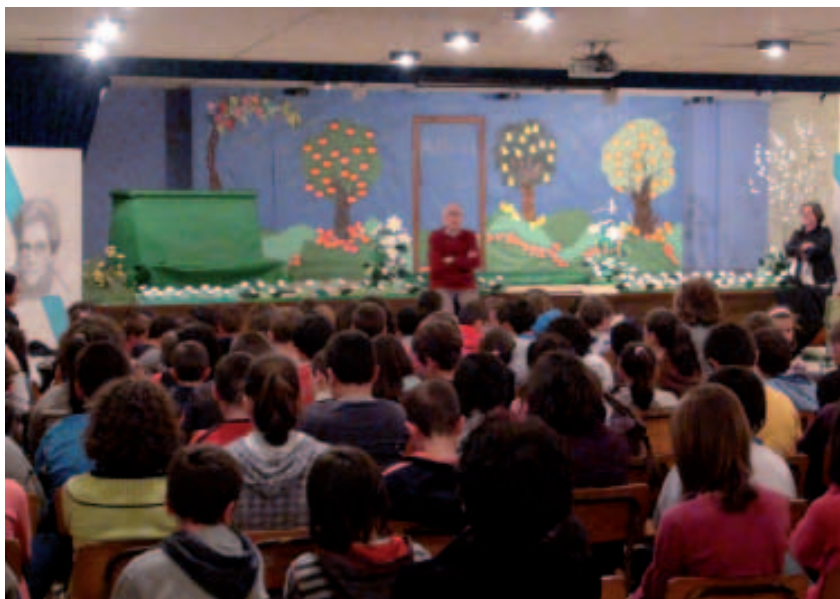
Xosé Neira Vilas como conferenciante para os nenos aos que presta unha especial atención na súa obra e no seu activismo cultural

entrou un militar, e ao vernos cantar díxonos que era un medio público e que debiamos calar. Como non lle fixemos caso mandou parar o Autobús e levounos a Comisaría de Caseros. O Comisario non sabía que facer con nós: Acusados de cantar. Primeiro fichounos: "Nombre?:" "-Xosé Neira Vilas", "nacionalidad?:" "-Gallego", e anotounos como galegos, mesmo aos arxentinos que viñan con nós. Pero ao rematar, como non sabía que facer con nós díxonos: "Miren, mientras dure la provincia de Buenos Aires, se me van calladitos, ahora en cuanto crucen la Avenida del General Paz, entonces hagan lo que quieran que ya no es de mi jurisdicción". E así fixemos. E o militar seguía. E aínda quedaba unha hora de viaxe.