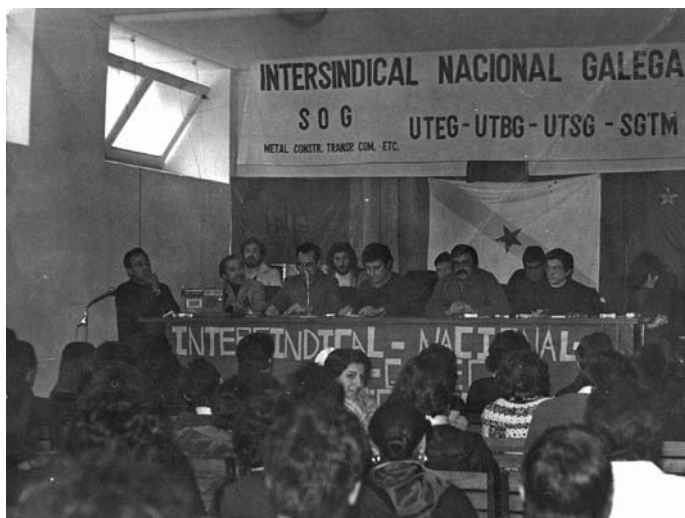
Presentación do ING no antigo local do Sindicato Vertical (Vigo, 1977).

“diferencial na loita obreira, tendo en conta, por conseguinte, as contradicións particulares que arrodean ao proletariado galego, o sindicato como órgano de canalización das aspiracións dos e das traballadoras debe ser galego”.