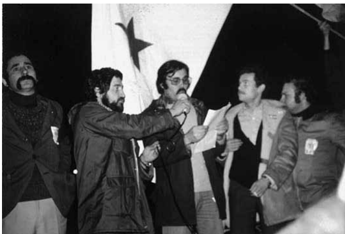
Mobilización contra os Pactos da Moncloa (Vigo, 1977).

contribuíron a consolidar o SOG no sector, por exemplo a experiencia de Chaves foi moi importante.