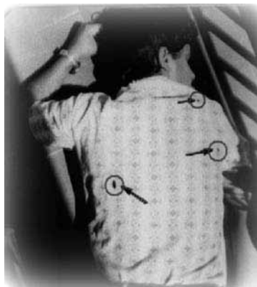
Foto da camisa que levaba Moncho o 12 de agosto de 1975. Sinálanse as marcas das balas.

Malferido e agonizante –un dos disparos afectoulle unha arteria por riba do corazón, producíndolle unha “anemia aguda e fulminante”– só lle deu tempo a chegar ao portal da Rúa Terra, Nº 27, onde se desangrou. Tardaron máis de 2 horas en entrar e descubrir o cadáver. Antes cribaron o portal a balazos con máis de cen impactos e, finalmente, despois de entreabrir a parte superior da porta cuns troncos dunha obra próxima, guindaron dúas bombas de gas lacrimóxeno e atoparon o corpo.